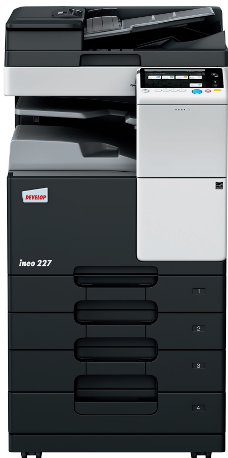
ineo 227 con alimentatore automatico (DF-628), separatore lavori (JS-506) e cassetto carta (PC-213)